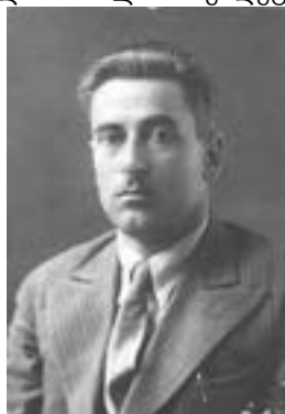
ლუკა ციხისთავი, 1935 წ.

ლუკა კი ქალიშვილის დაავადების ამბავს უკვე ციხეში გაიგებს, თუმცა, მხოლოდ 20 წლის შემდეგ, მასთან შეხვედრისას, ნახავს იმ მძიმე რეალობას, რომელთან პირისპირ აღმოჩნდნენ ნინა და პატარა ირაკლი, ლუკას დაპატიმრების დღიდანვე.