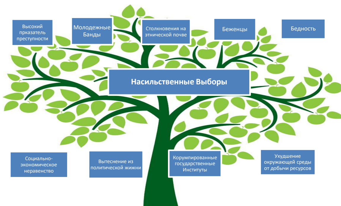
Диаграмма 36: Инструмент Анализа Древа

Во многих культурах есть виды деревьев и растений, такие как маниока или малиновый куст, которые регенируют даже после обрезания их верхушек. Эти растения являются метафорами для иллюстрации способности «корней» к регенерации и распространению, несмотря на попытки их уничтожения. Древо внизу иллюстрирует это.