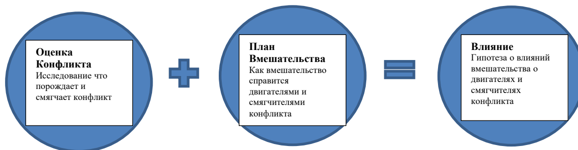
Диаграмма 37: Компоненты Теорий Перемен

Теорий изменений имеют три составляющие. Теория изменений о том как какой-то двигающий или смягчающий конфликт фактор идентифицированный в ОЦЕНКЕ КОНФЛИКТА может быть изменен с помощью некоторого ПЛАНА ВМЕШАТЕЛЬСТВА для достижения влияния.