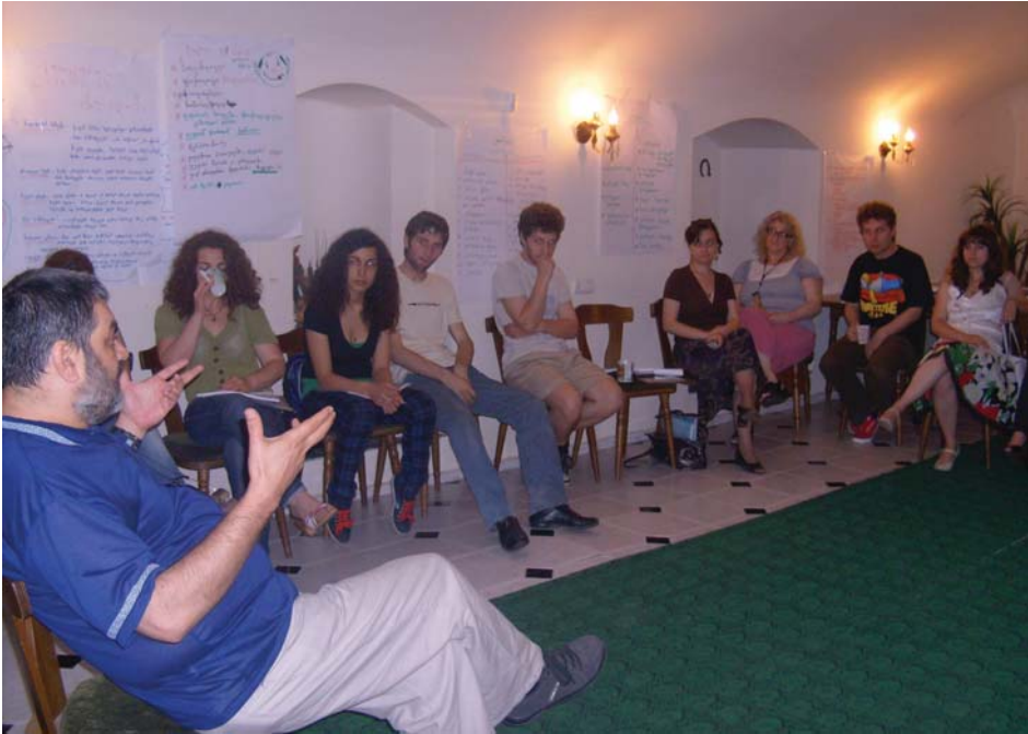
ტოლერანტული გარემო, ტრენინგი. ცენტრის ოფისი, თბილისი, 2009 წ.