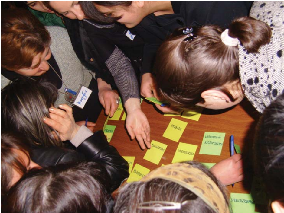
გენდერული ტრენინგი. ქუთაისი, 2010 წ.