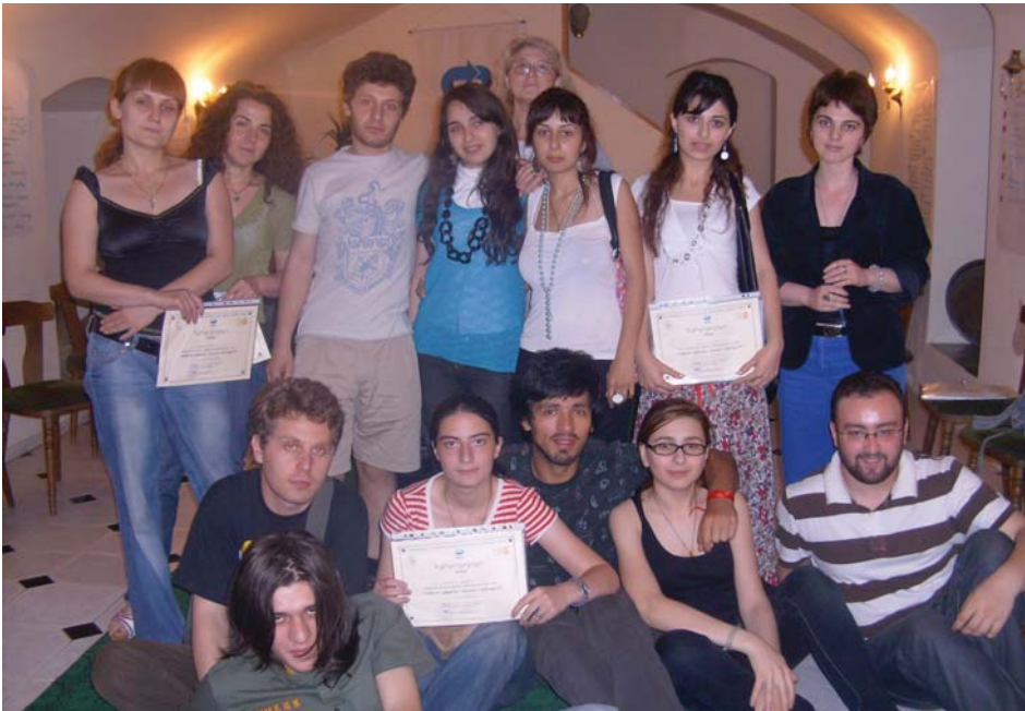
დავძლიოთ გენდერული ძალადობა. ცენტრის ოფისი, თბილისი, 2009 წ.