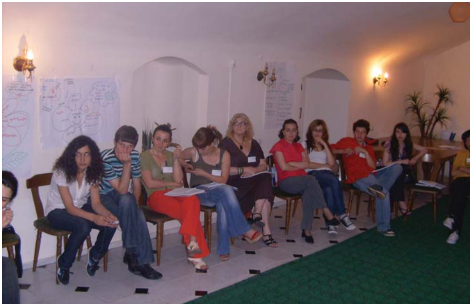
ახალგაზრდული ჯგუფი. ცენტრის ოფისი, თბილისი, 2009 წ.