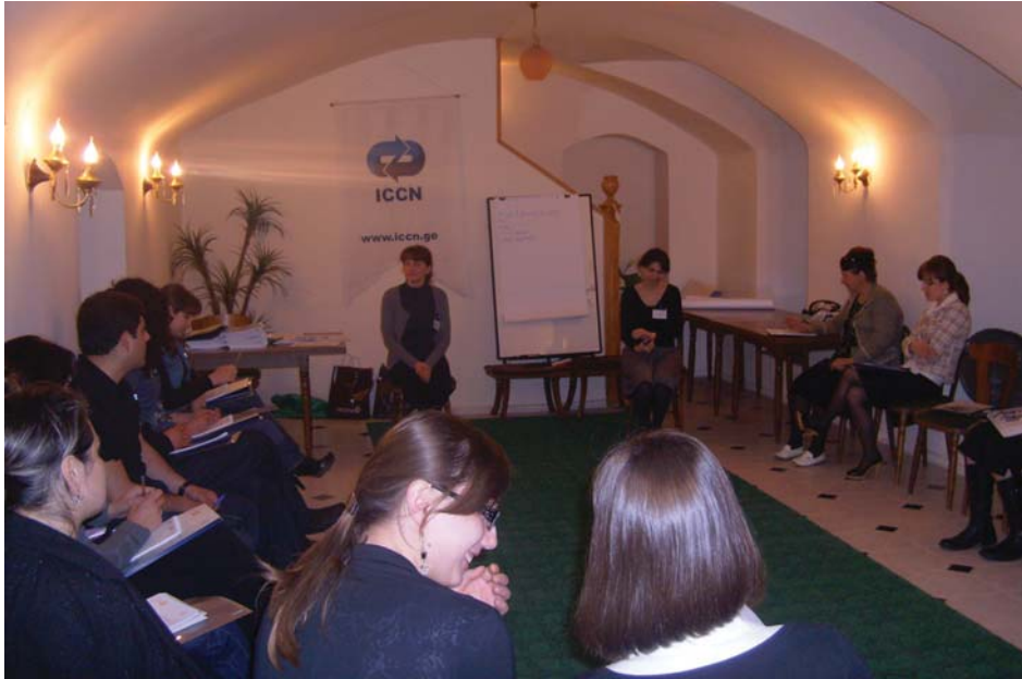
გენდერული ტრენინგი. ცენტრის ოფისი, თბილისი, 2008 წ.