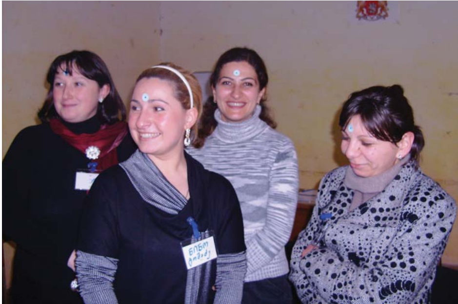
მრავალფეროვნების მართვის ტრენინგი. ახალციხე, 2010 წ.